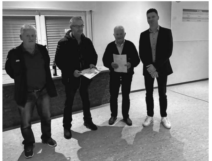
Unsere Jubilare „50 Jahre“