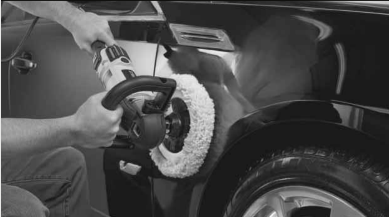
Lackaufbereitung ist weitaus mehr als nur eine einfache Politur des Autolackes.