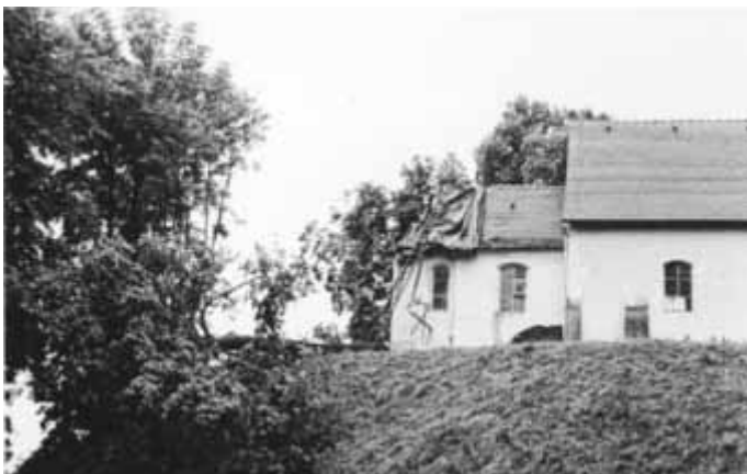
Nach dem Blitzeinschlag 1966