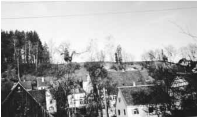
Blick auf die untere Berglinde – vor ca. 80 Jahren

Diese obere Linde bei der Kapelle wurde 1966 während eines Unwetters durch einen Blitzeinschlag völlig zerstört.