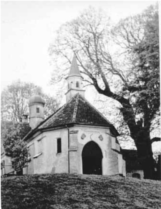
Die obere Berglinde vor dem Blitzeinschlag