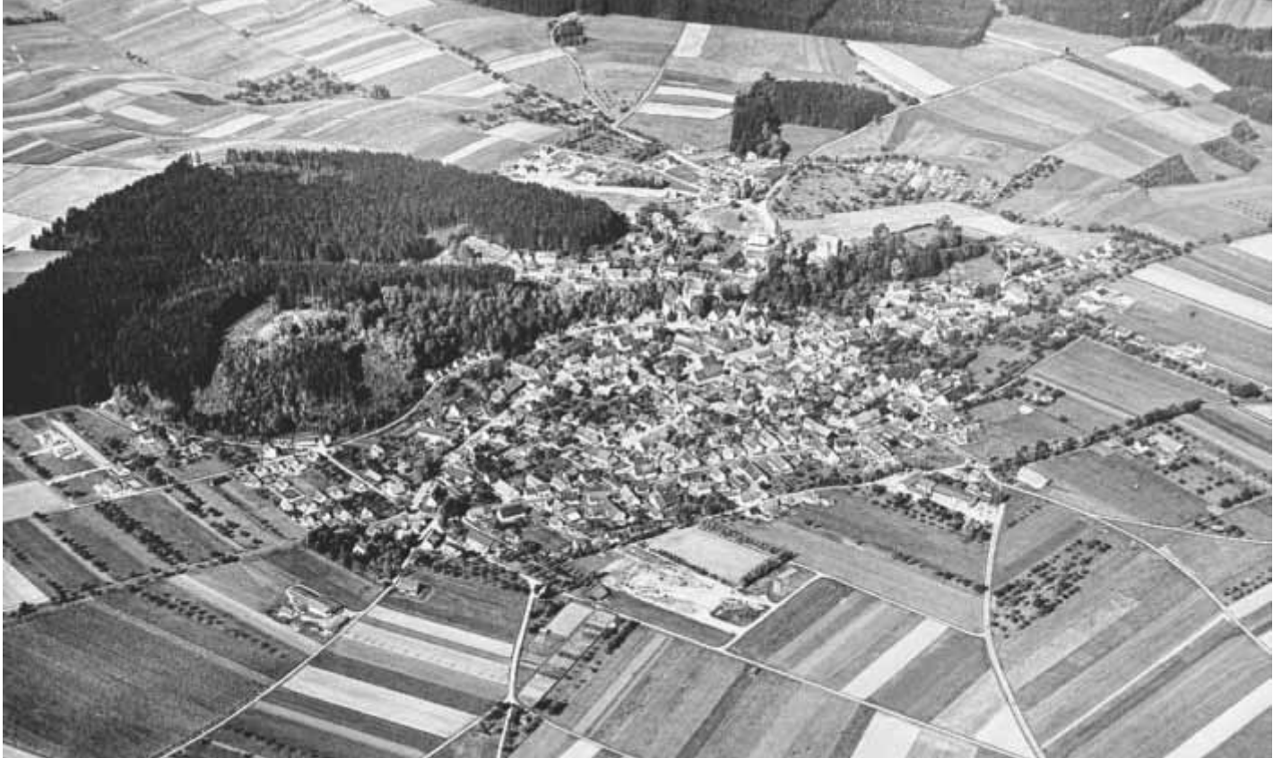
Aufnahme Wohnort Erolzheim von 1966

Im Bildarchiv der Gemeinde befinden sich viele interessante Luftbilder, die die Entwicklung der Gemeinde einschließlich der Teilorte aufzeigen. Besonders interessant daran ist, dass die Gemeinde im vergangenen Mai neue Luftbilder von der Gesamtgemeinde anfertigen ließ und somit ein aktueller Vergleich mit teilweise sehr alten Bildern gemacht werden kann.