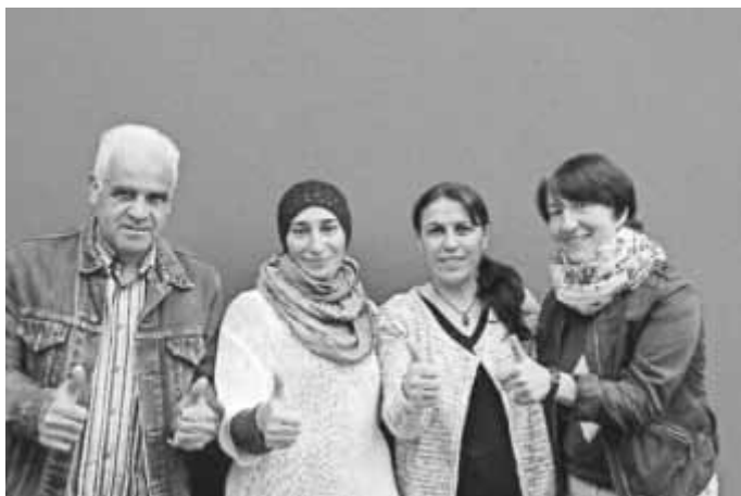
Die syrische Theatergruppe spielt „Flucht ins gelobte Land“