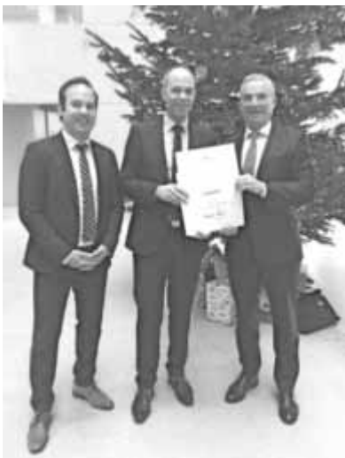
Bescheidübergabe im Ministerium für Inneres, Digitalisierung und Migration (von links nach rechts: MdL Raimund Haas, Bürgermeister Ackermann, Innenminister Thomas Strobl)

Die Gemeinde Erolzheim erhält für den vorgesehenen Breitbandausbau für die Teilorte Bechtenrot, Edelbeuren und Dietbruck mit Kosten von knapp einer Million Euro einen Zuschuss von 670.000 Euro. Mit der Bewilligung des Bescheides kann die Baumaßnahme nun kommendes Jahr angegangen werden.