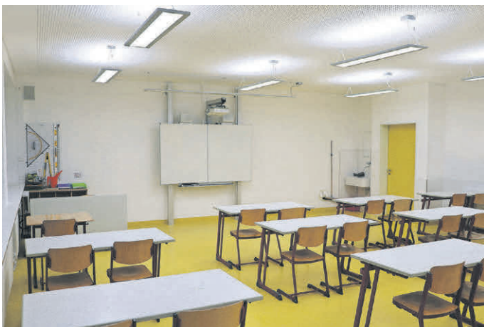
Neu eingerichtetes Klassenzimmer mit digitaler Tafel

Mit dem L-Bau konnte ein weiterer Sanierungsabschnitt in der Realschule fertiggestellt werden. Der Schule stehen neben neuen Klassenzimmern, nun auch neue Fachräume für Kunst, Technik und eine neue Lehrküche zur Verfügung.