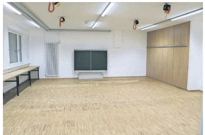
Neuer Technikraum (noch ohne Werkbänke)