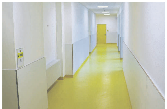
Neu und hell gestalteter Flur

Derzeit laufen die Vorbereitungen für den letzten Bauabschnitt mit dem Erdgeschoss im Hauptbau und dem Erweiterungsbau am Realschulweg. Nach Verlegung des Servers und der Verkabelung können im Februar die Arbeiten begonnen werden. Ziel ist es, bis zum Herbst die Generalsanierung der Realschule abzuschließen.