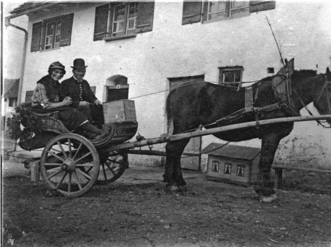
Ein Zweispänner mit einem Fasnetspärchen in den 30er Jahren macht in der Langgasse Halt vor einem Bauernhaus