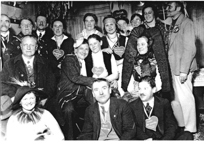
Lustige Fasnet-Gesellschaft der Ortsgruppe des Schwäbischen Albvereins anno 1938 im Gasthaus Rad