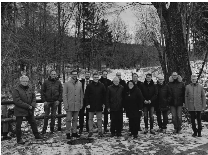
Vertreter des Wasser- und Bodenverbands Rottal beim Baustart auf der sog. „Luftseite“ des HRB Ölbach

Die Baukosten für die Sanierung des Hochwasserrückhaltebeckens liegen bei ca. 4,2 Mio €. Die gesamte Maßnahme inkl. der Baunebenkosten wird voraussichtlich ca. 4,8 Mio € kosten.