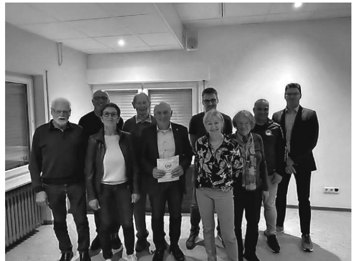
Unsere JUBILARE „25, 40, 50 und sogar 60 Jahre“ bei der Urkundenverleihung