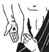
Ulrich Loose Gott! <<

» Da kam Jesus bei verschlossenen Türen, trat in ihre Mitte und sagte: Friede sei mit euch! Dann sagte er zu Thomas: Streck deinen Finger hierher aus und sieh meine Hände! Streck deine Hand aus und leg sie in meine Seite und sei nicht ungläubig, sondern gläubig! Thomas antwortete und sagte zu ihm: Mein Herr und mein