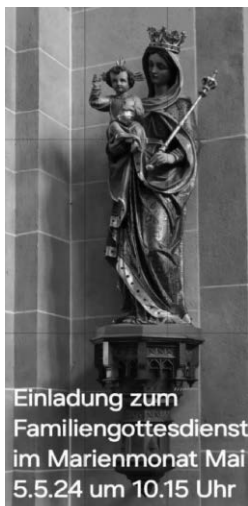
Einladung zum Familiengottesdienst im Marienmonat Mai 5.5.24 um 10.15 Uhr

Die Vertretung hat das Pfarrbüro in Kirchdorf.