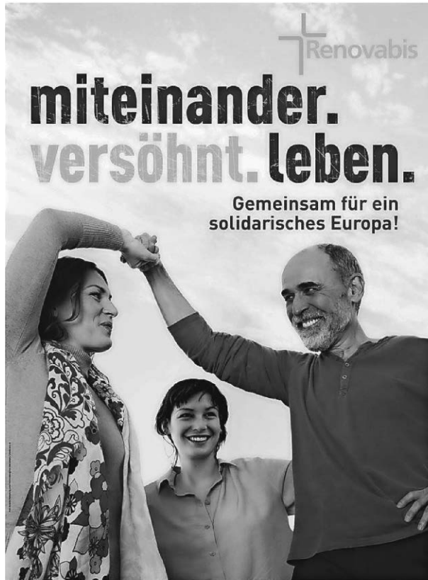
Pfingstkollekte am 20. Mai 2018