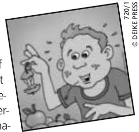
720/1 720R20R1

Normalerweise entfernt man das Kerngehäuse der Äpfel. Beißt man auf einen Apfelkern, entsteht ein bitterer Geschmack im Mund. Dieser kommt von der Substanz Amygdalin, die von unserem Körper in Blausäure umgewandelt wird. In größeren Mengen ist Blausäure giftig. Über ein paar verschluckte Apfelkerne müssen wir uns aber dennoch keine Gedanken machen, denn das ist zu wenig, um Schaden anzurichten. Völlig ungefährlich ist die Säure, wenn wir die Kerne gar nicht zerkauen, sondern im Ganzen herunterschlucken. Dann scheidet sie unser Körper unverdaut wieder aus. Auch die Kerne von einigen anderen Früchten enthalten Amygdalin.