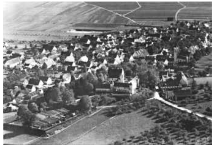
Erolzheim – Ausschnitt aus einem Luftbild von 1931

Der Poststempel „27.4.1952“ auf der „Schloss-Karte“ aus unserem Postkarten-Archiv sagt ja nicht aus, wann sie aufgelegt wurde. Gedruckt wurde diese Karte vom Verlag F. Buckmann aus Erolzheim. Über das „wann“ darf man gerne spekulieren. Alte Schriften belegen, dass das Hauptgebäude des Schlosses am 13.9.1945 aus Unachtsamkeit der französischen Besatzungssoldaten komplett abgebrannt ist und danach nur die äußere Hülle wieder errichtet wurde. Das Gebäude auf der Karte vermittelt aber nicht den Eindruck einer leeren Gebäudehülle. Ich gehe davon aus, dass es diese Karte schon lange vor dem Schlossbrand 1945 gab. Man sieht auf beiden Bildern sehr schön, dass der heutige Festplatz für das Musikvereinszelt früher ein großer Krautgarten war, der die Schlossbewohner und vielleicht auch die Dorfbevölkerung mit frischen Gartenerzeugnissen versorgte. Dieses Krautland gibt es schon lange nicht mehr. Das erste „Erolzheimer-Festzelt“ vom Musikverein in der sehr langen Patroziniums- und Heimatfesttradition stand 1969 hier in diesem ehemaligen Gemüsegarten der früheren Schlossherrschaft. Hoffen wir, dass im Protokoll 2021 des Musikvereins unter dem TOP Heimatfest nicht wieder - wie 2020 - „wegen Corona ausgefallen“ notiert sein wird! Werner Altvater