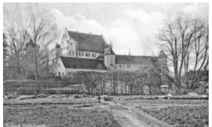
Postkarte „Schloß Erolzheim“ mit Brauerei-Gebäude und im Vordergrund der im Text erwähnte Krautgarten.