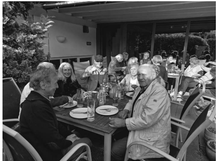
Hockete nach der Radtour