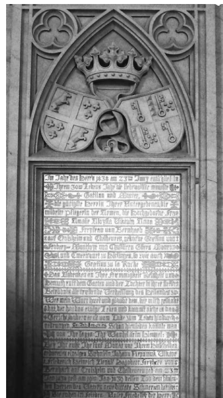
Epitaph mit dem oben abgedruckten Text

Schon hienieden konnte man von ihr sagen: Ihr Wandel ist im Himmel: Bei ihr ruht ihr fünf Monate vor ihrem Hinschei-