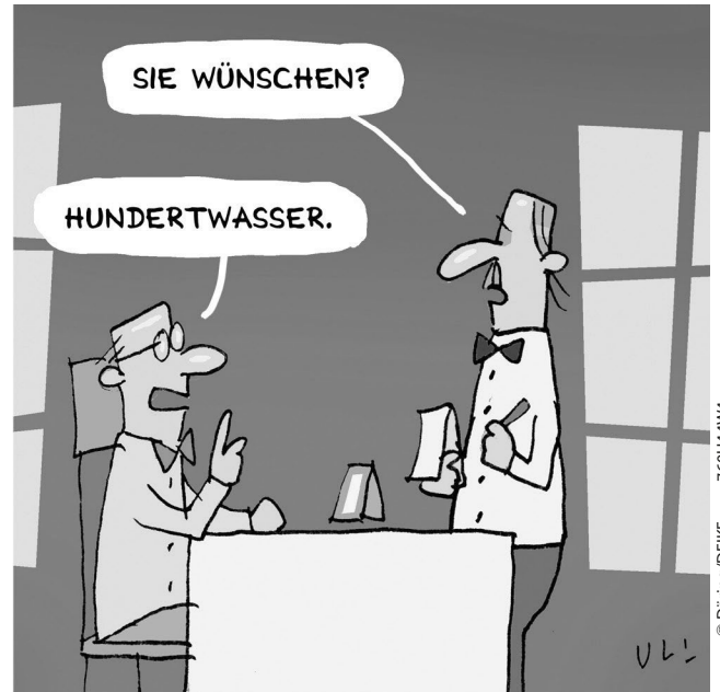
HAMSTERN IN DER KULTURGASTRONOMIE

Die monatlichen Berichte und Prognosebetrachtungen des Folgemonats dienen heute auch als Gradmesser für die Auswirkungen des Klimawandels auf das Grundwasser. Die Webseite GuQ hat entsprechend einen wachsenden Nutzerkreis.