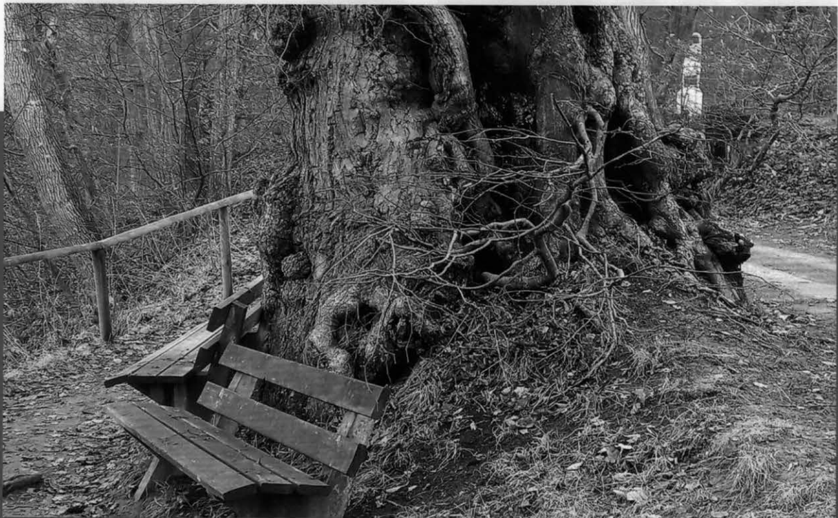
Die Winterlinde am Kapellenberg in Erolzheim ist seit 1939 geschütztes Naturdenkmal.

anzurechnen, dass sie die Linde erhalten haben, offenbar wohl wissend, dass diese Baumart trotz natürlicher Beeinträchtigungen ungemein vital und langlebig ist und sich aus eigener Kraft wieder regenerieren kann. Der heutige Torso gibt ihnen nachträglich Recht und zeigt, wie er im Zeitverlauf mit bizarren Adventivbildungen, zahlreichen Maser- und Knollenverwachsungen innen verbliebene Hohlräume überwinden und sich wieder stabilisiert hat. Mehrere freiliegende „Luftwurzeln“ verstärken das für Laubbäume typische Zugholzwachstum und wirken der talseitigen Kronenbelastung entgegen. Am oberen Ende des Hauptstamms ist die ehemaligen Abbruchstelle inzwischen weitgehend überwältigt. Derzeit bilden drei früher untergeordnete Kernwüchse die heutige Krone, die in