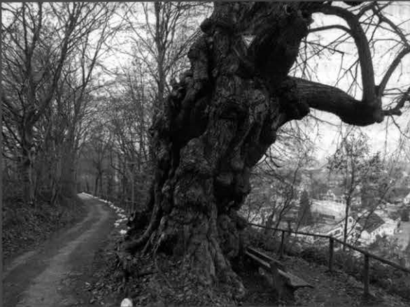
Als Pflanzjahr wird 1130 n.Chr. angegeben.

Konkurrenz zu einer benachbarten Stieleiche stehen. An talseitig ausladenden Ästen wurden bei lang zurückliegenden Baumpflegearbeiten große Schnittstellen hinterlassen, so dass diese seither durchgehend ausgefault sind.