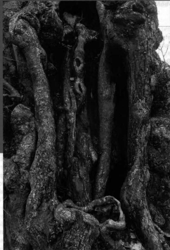
Der Torso zeigt bizarre Bildungen, Verwachsungen, Luftwurzeln und Hohlräume.

Der Baumtorso hat sich längst zu einem eigenständigen strukturreichen Biotop entwickelt. Vielfältige Hohlräume, Nischen und die Wurzelbrut bieten Quartiere und Nahrungsquellen für zahlreiche Insekten mit ihren Entwicklungsformen, besonders für Bienen, Spinnen- und xylobionte Käferarten sowie Kleinvogel- und Fledermausarten.