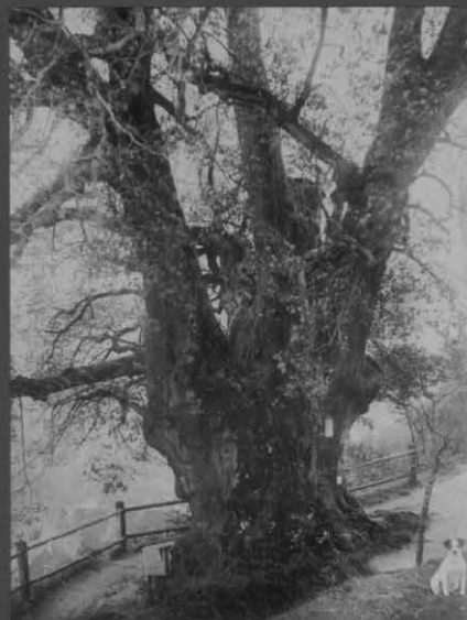
Historisches Bild von 1894: Damals hatte der Baum noch einen Umfang von 9,20 m. Quelle:Heimatbuch Erolzheim (1990). Alle Fotos: Erich Lamers

Pilzmyzelien befördern die Fäulnisprozesse. Die Untere Berglinde an der Hangkante des ehemaligen Schaf- und Ziegenbergs der söldnerischen Bürgerschaft ist auf alten Lithographien als dominanter Landschaftsbild prägender Solitärbaum unübersehbar. Die Linde hat viele Generationen kommen und gehen sehen, wie der Erolzheimer Chronist Schultzeiß Bär (1859 – 1899) in seinem Gedicht über den Baum beschreibt. Im Schatten ihres Laubwerks wurde gerastet, musiziert, gesungen, getanzt, geträumt, gelacht und wohl manches Schäferstündchen verbracht. „Sie möcht' es uns erzählen, oh könnten wir's versteh'n“.