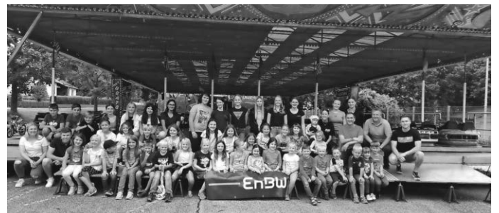
Der Kindernachmittag wurde durch die EnBW gesponsert

Zum Abschluss des Festwochenendes lockte die Abschiedstour „20 Jahre sind genug“ der Band Notausgang zur Dirndl- und Lederhosenparty die Besucher trotz widrigem Wetter ins Zelt. Mit bester Stimmung feierten wir mit Notausgang ihren Abschied vom Erolzheimer Heimatfest, welches sie viele Jahre mit ihrer Musik treu begleitet haben.