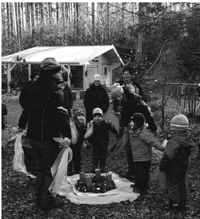
Kleiner, grüner Kranz

Wir wünschen allen schöne Weihnachten und einen guten Rutsch ins neue Jahr 2018!