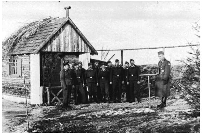
Appell der Soldaten der Flugmeldestelle Erolzheim vor ihrer Baracke an der Dettinger Straße. Am rechten Bildrand steht bereits der Weihnachtsbaum.

Achtung: Überfüllte Mülltonnen werden nicht geleert und bleiben stehen!!!