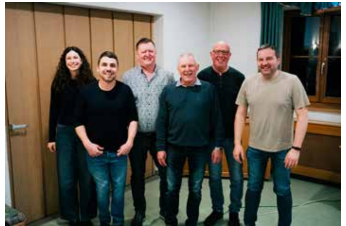
Vorstandschaft des Fördervereins