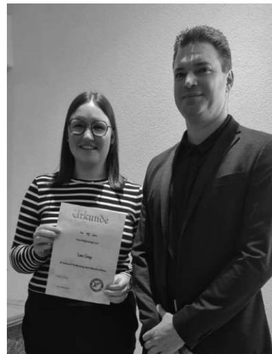
Unsere Jubilarin „25 Jahre“